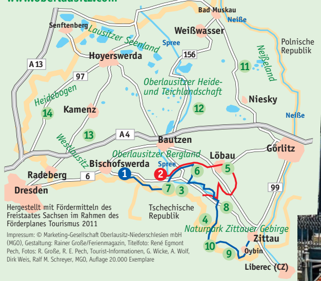
Hergestellt mit Fördermitteln des Freistaates Sachsen im Rahmen des Förderprogramms Tourismus 2011 Impressum: © Marketing-Gesellschaft Oberlausitz-Niederschlesien mbH (MGN), Gestaltung: Rainer Groß/Ferienmagazin, Auflage 20.000 Exemplare

Herzlich willkommen! Wutrobnje witajce Mehr Informationen: Marketing-Gesellschaft Oberlausitz-Niederschlesien mbH Tzschirnerstraße 14a, 02625 Bautzen Tel. +49 3591 48770, Fax +49 3591 467748 info@oberlausitz.com www.oberlausitz.com