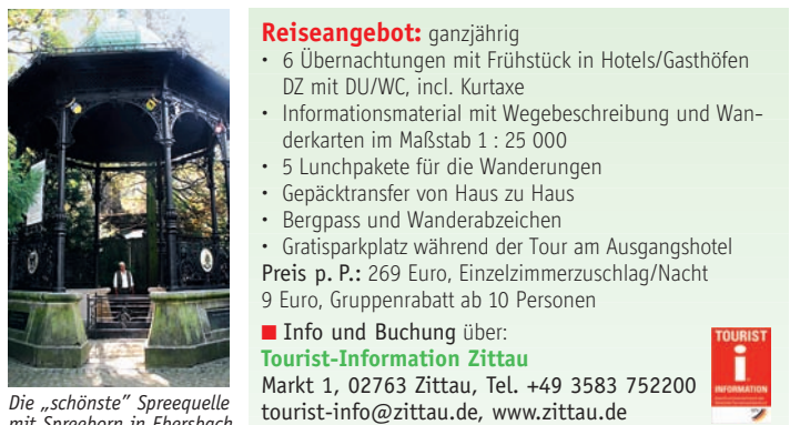
Die „höchstgelegene“ Spreequelle am Kottmar Die „wasserreichste“ Spreequelle in Neugersdorf Die „schönste“ Spreequelle mit Spreeborn in Ebersbach