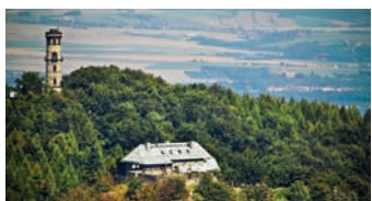
Hochwald mit Hochwaldbaude und Turm

Reiseangebot: ganzjährig • 7 Übernachtungen mit Frühstück in Hotels/Gasthöfen, DZ mit DU/WC und incl. Kurtaxe • Informationsmaterial mit Wegebeschreibung und Wanderkarten im Maßstab 1 : 25 000 • 6 Lunchpakete für Wanderungen • Gepäcktransfer von Haus zu Haus • Bergpass und Wanderabzeichen • Gratisparkplatz während der Tour am Ausgangshotel Preis p. P.: 345 Euro Einzelzimmerzuschlag/Nacht 10 Euro Gruppenrabatt ab 10 Personen Info und Buchung über: Tourist-Information Zittau Markt 1, 02763 Zittau Tel. +49 3583 752200 tourist-info@zittau.de www.zittauer-gebirge.com www.oberlausitzer-bergweg.de