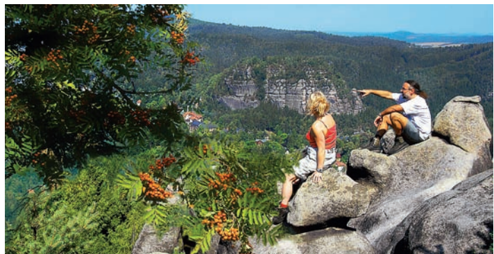
Im Naturpark Zittauer Gebirge