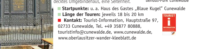
Dorfkirche und Umgebendehaus-Park Cunewalde

Die Rundwanderwege um vier Orte, mit der Wegemarkierung „Grüner Punkt“ sowie dem Anfangsbuchstaben des jeweiligen Ortes markiert, bilden das „Oberlausitzer Kleeblatt“. Sie führen durch das Oberlausitzer Bergland und bieten unterwegs die schönsten Fernsichten. Sehenswürdigkeiten locken zum Verweilen – so auf dem „Rundwanderweg Cunewalde“ die größte Dorfkirche Deutschlands, ein Umgebendehaus-Park (Modelle im Maßstab 1:5) und der Dreiseitenhof mit Oldtimermuseum; auf dem „Rundwanderweg Kleindehsa“ ein Kletterfelsen mit Gipfelbuch (Hochstein); auf dem „Rundwanderweg Lauba-Lawalde“ die Kirche mit freistehendem Glockenturm; auf dem „Schönbacher Ringwanderweg“ ein strohgedecktes Umgebendehaus, eine Seltenheit. ■ Startpunkte: u. a. Haus des Gastes „Blaue Kugel“ Cunewalde ■ Länge der Touren: jeweils 18 bis 20 km ■ Kontakt: Tourist-Information, Hauptstraße 97, 02733 Cunewalde, Tel. +49 35877 80888, touristinfo@cunewalde.de , www.oberlausitzer-wander-kleeblatt.de