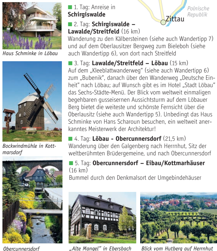
Haus Schminke in Löbau Bockwindmühle in Kottmarsdorf Obercunnersdorf „Alte Mangel“ in Ebersbach Blick vom Hutberg auf Herrnhut