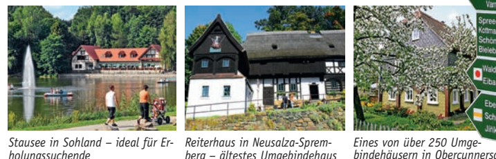
Stausee in Sohland – ideal für Erholungssuchende Reiterhaus in Neusalza-Spremberg – ältestes Umgebendehaus Eines von über 250 Umgebendehäusern in Obercunnersdorf Zittau, dahinter der Obbersdorfer See und der Naturpark Zittauer Gebirge