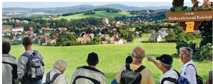
Blick von den Bergen auf Schirgiswalde