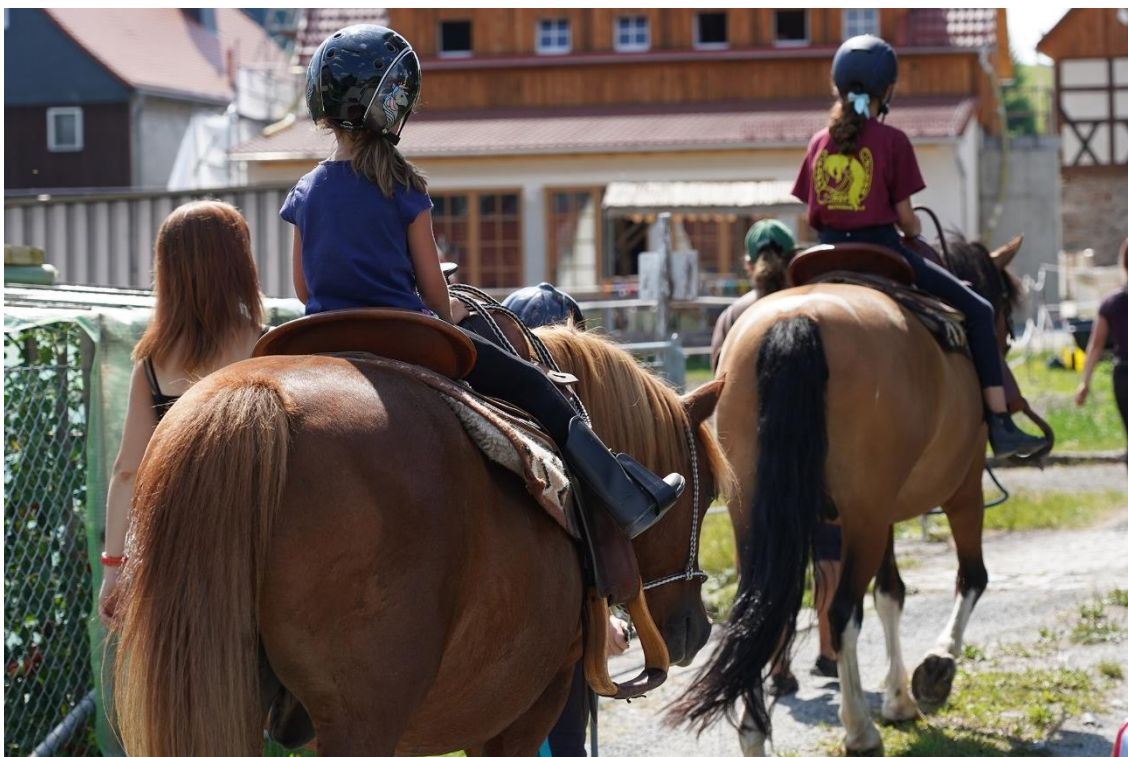
Ponyreiten auf dem Lerchenberghof

Im Lerchenberghof weisen Flyer und Aufkleber mit QR-Code an vielen Stellen auf den famil-o-mat hin. „Wir empfehlen ihn unseren Urlaubern auch aktiv“, schildert Lehmann. Das Feedback sei jedes Mal sehr positiv. Viele Familien würden gerade beim morgendlichen Frühstück gemeinsam online schauen, was sie am Tag unternehmen wollen. Der Lerchenberghof ist selbst mit gleich vier Angeboten im Online-Tool vertreten: mit Ponyreiten, Segway-Touren, einer historischen Hofführung und der Sagenpfad-Wanderung auf dem „Kottmar“.